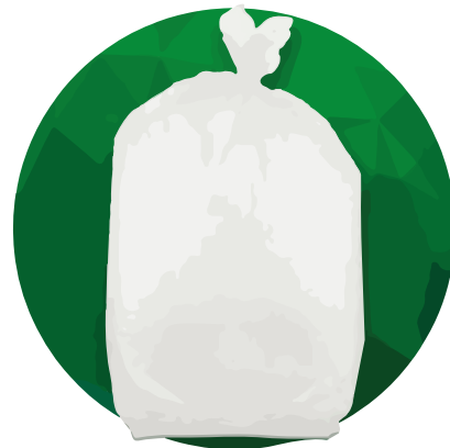
Empaque transp. 200Lts 57(16+16)x120x0.006