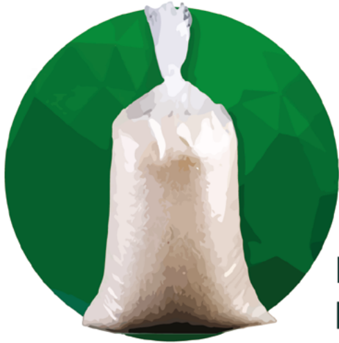
Empaque para arroz 33(7+7)x74x0.011