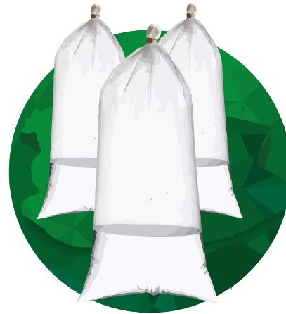
Empaque para Hielo 15x44x0.004