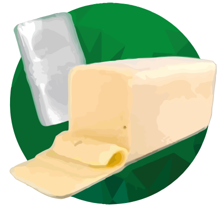
Empaque para Queso pasteurizado 11(5+5)x50x0.006