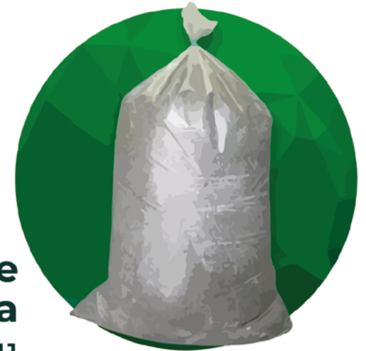
Empaque para arena 34x66x0.011