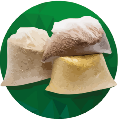
Empaque para Grano 30x45x0.010