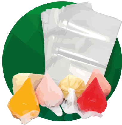
Empaque para Teta 13x23x0.004