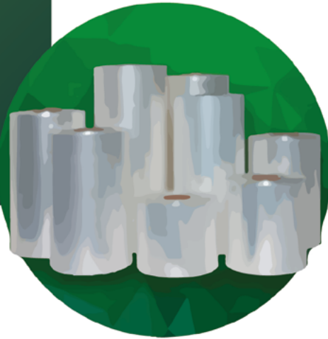
Bobina Transparente 145x0.040