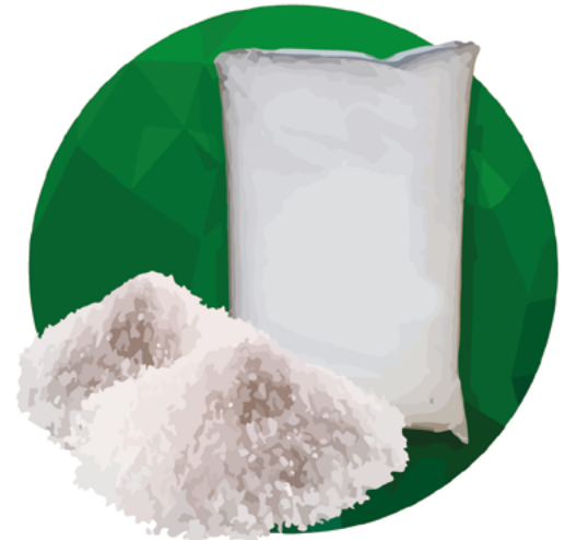
Empaque para Sal (18 a 20Kg) 40x60x0.018

Estos productos están disponibles en TRANSPARENTE. Si gusta puede solicitar variación en: Color, Impresión, Densidad o algún otro cambio según su requerimiento.