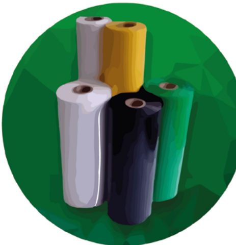
Bobina Pigmentada 145x0.040