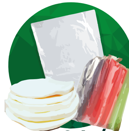
Duro frío/cebu 23x50x0.006